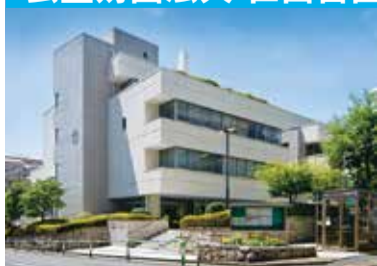
(公財)世田谷区保健センターは区立保健センターと区立総合福祉センターを運営しています。

☎3410-9101(代) 〒154-0024 世田谷区三軒茶屋 2-53-16