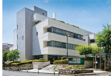
(公財)世田谷区保健センターは区立保健センターと区立総合福祉センターを運営しています。

保健センター「げんき人」は、総合支所などの区の施設においてあります。次回発行は平成31年4月15日の予定です。